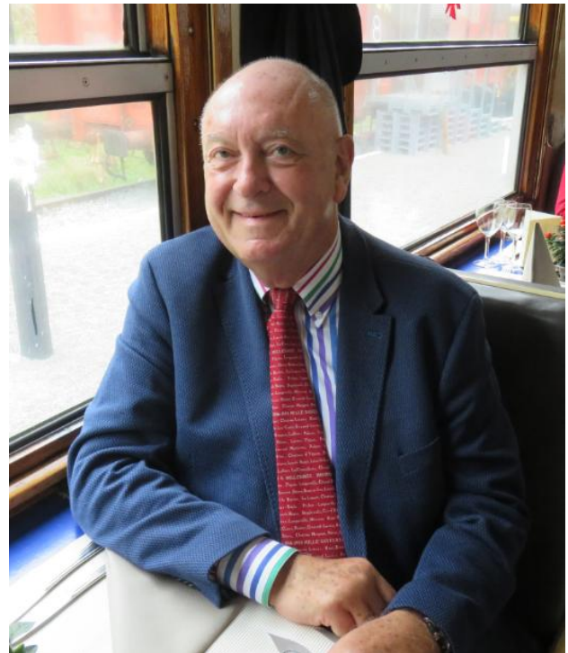
À bord du Bocq-Gourmand, le 07 octobre 2017