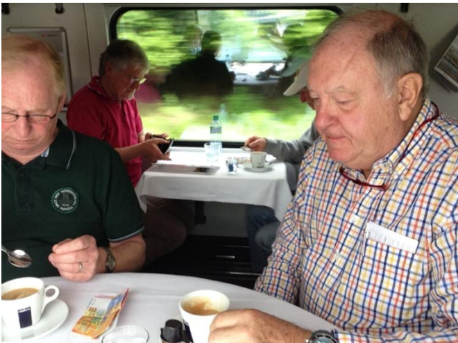
Un petit-café à bord d'une rame ICN des CFF, le 05 juin 2016