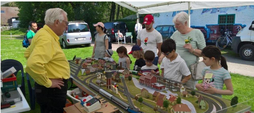
Notre stand au Petit Train à Vapeur de Forest le 21 avril