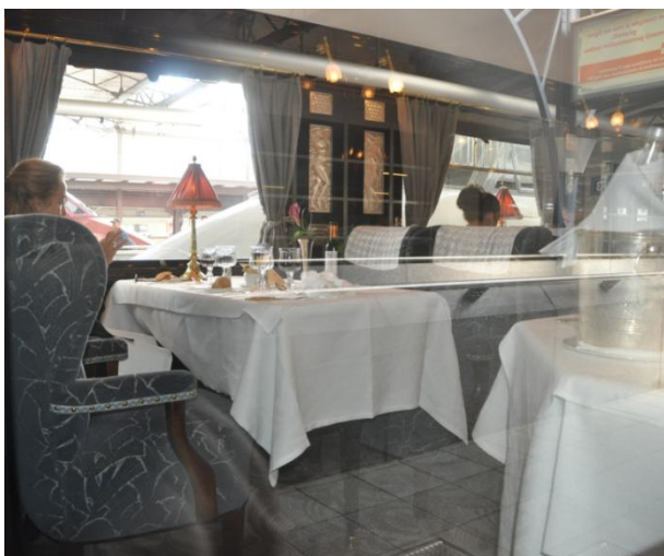
Voiture-Restaurant de l'Orient-Express, 18/05/2014

Pour accéder aux places assises, deux systèmes seront utilisés dans les premiers temps. Les voitures à l'anglaise, imitant la diligence, sont dotées de portes latérales de chaque côté du compartiment permettant d'accéder rapidement à leur place. Le système américain prévoit un accès par les extrémités des voitures constituées par une salle unique traversée par un couloir central.