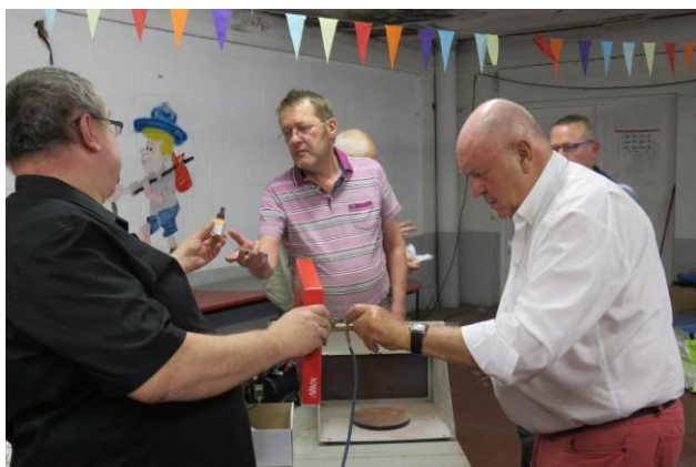
Atelier « Aérographe » le 26 juin