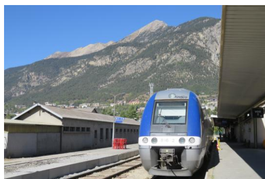
Notre train en gare de Briançon le 28 septembre