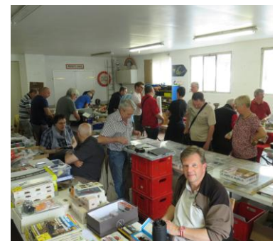
Notre bourse le 27 mai