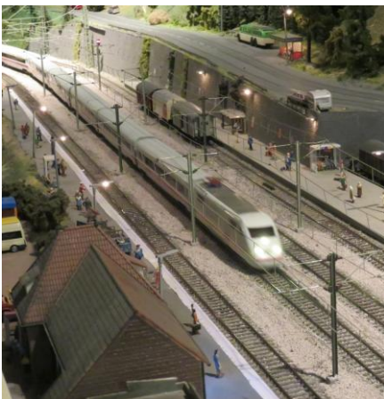
Très belle excursion à Ars-Tecnica Le dimanche 11 mars