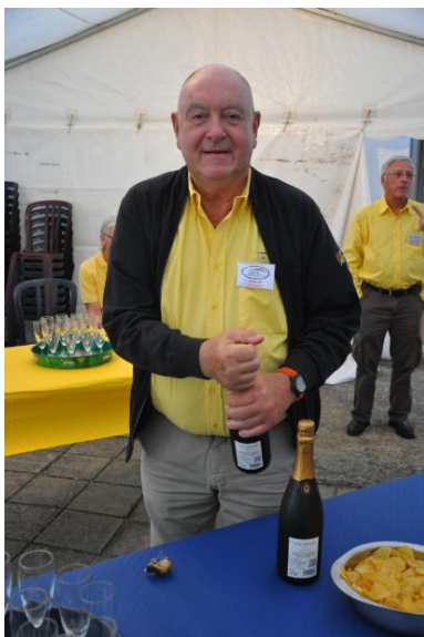
À l'occasion de notre week-end portes ouvertes en août 2018

Vous trouverez ci-dessous quelques photos prises lors de nos dernières manifestations.