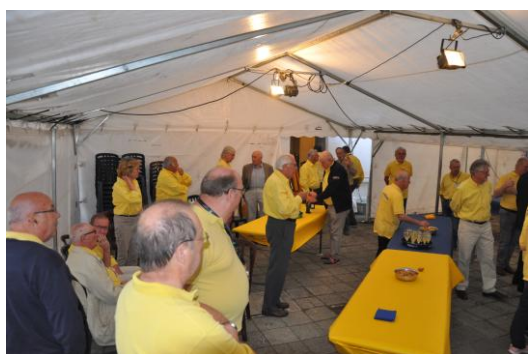
Ouverture de notre week-end portes ouvertes le 24 août