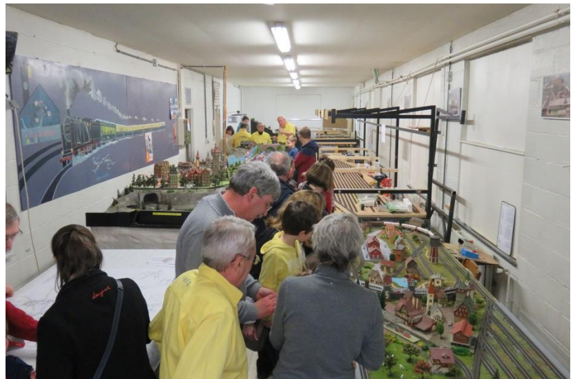
Succès pour notre ouverture à l'occasion du week-end « Wallonie-Bienvenue » le 25 mars