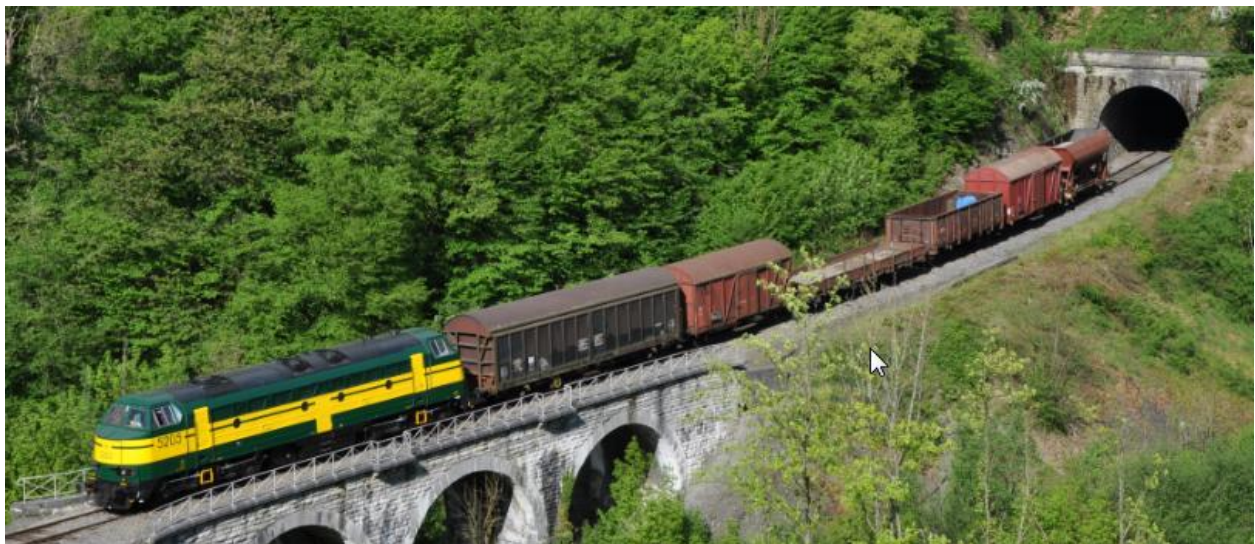
Un train du PFT sur le chemin de fer du Bocq, le 14 mai 2016

Il est temps d'en arriver à nos wagons, nom utilisé pour le transport des marchandises. Du côté germanique, le mot utilisé pour le moyen de transport se traduit par wagen.