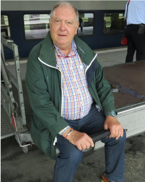
En attendant un train en gare de Lucerne, le 5 juin 2016