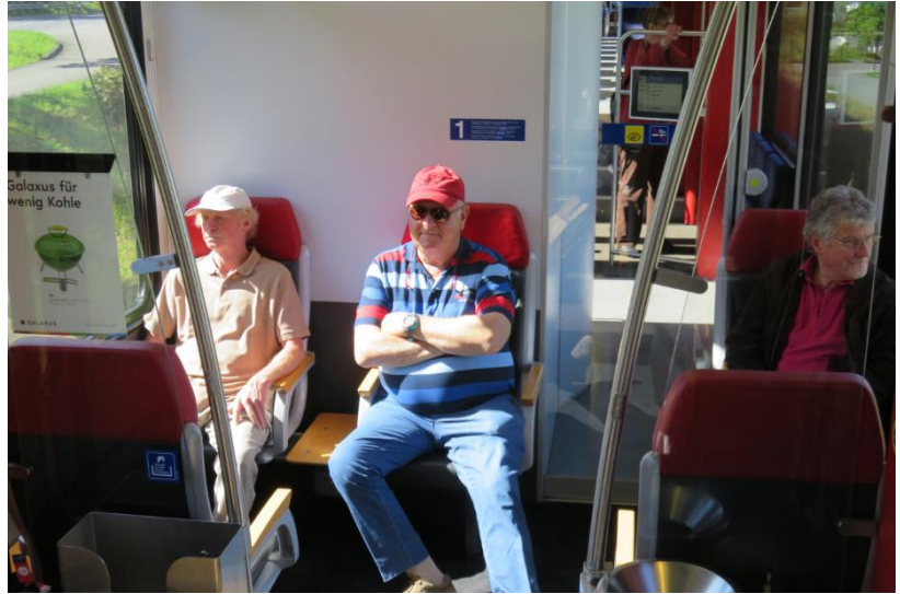
À bord du Luzern-Interlaken-Express, le 6 juin 2016