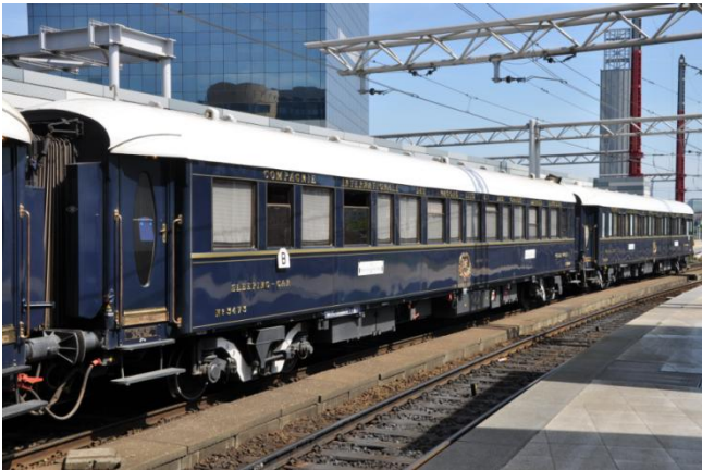
L'Orient-Express à Bruxelles-Midi le 18 mai 2014

Le belge Nagelmackers s'inspira du modèle américain pour lancer la Compagnie Internationale des wagons-lits. Il présente deux innovations dans le domaine. La configuration de ses voitures se présente avec un couloir latéral et à cabines fermées se succédant de l'autre côté.