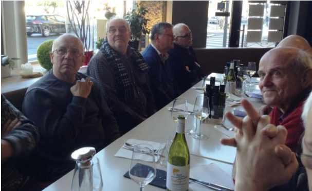
Le repas lors de notre visite à l'expo de Lille le 10 février

Petit retour en arrière avec cette rétrospective de l'année écoulée, composée de ces quelques photos de nos nombreuses activités.