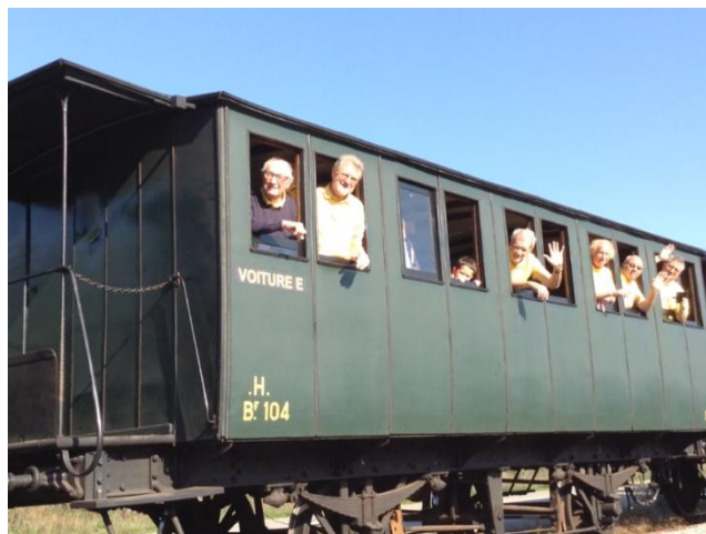
Voiture du train touristique Thur-Doller-Alsace

Cette classe sera assez vite supprimée suite à l'accélération de la vitesse des trains. Au début du XXème siècle, la classe 4 sera temporairement réinstaurée en Alsace Lorraine sous contrôle allemand. La voiture se composera d'une caisse fermée sans siège avec barres verticales pour permettre aux voyageurs de se maintenir durant les trajets.