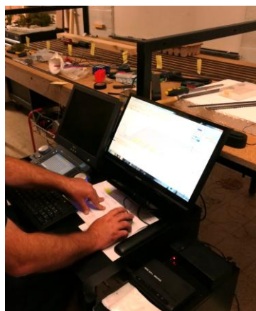
Travail au finish pour le réseau 2R en août