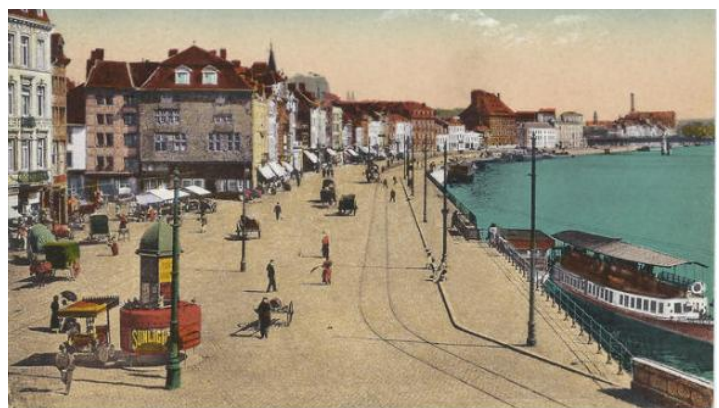
Le quai de la batte à Liège

Un quai célèbre en Belgique mérite une mention dans cet article à savoir le quai de la batte à Liège. Au XVI e siècle, les autorités communales décident d'ériger un mur le long de la Meuse pour l'accostage de bateaux. Une ligne de tramway y fut installée au début du XX e siècle. En vieux wallon liégeois, ce type de digue s'appelle une batte. L'appellation actuelle de quai de la batte révèle donc un pléonasse qui n'a pas été rectifié lors des travaux d'aménagement en 1993.