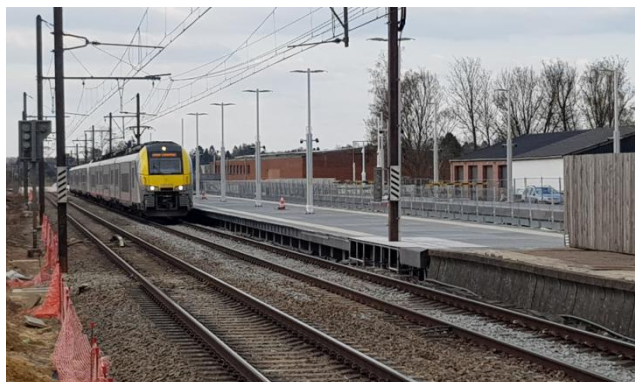
Anciens et nouveaux quais se côtoient temporairement À la gare de Waterloo

La présence de voies ferrées n'entraînera pas nécessairement la construction d'un quai. Généralement, on trouvera la disposition de deux voies entre deux quais. Dans certaines gares, il n'y aura qu'une voie entre deux quais. En l'absence de réglementation européenne unique, chaque pays édictera ses propres règles en matière de hauteur de quais. C'est la variété des voitures qui empêche l'harmonisation en matière de hauteur. L'union internationale des chemins de fer recommande une longueur de quai de 400 mètres permettant l'arrêt d'un convoi d'une locomotive et de 14 voitures. Les gares TGV prévoient une longueur de 500 mètres pour accueillir leur convoi.