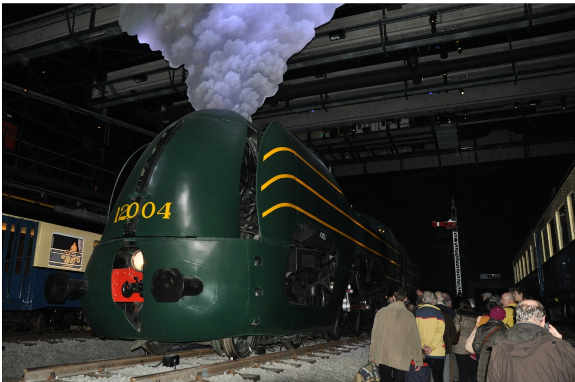
Notre excursion à Train World